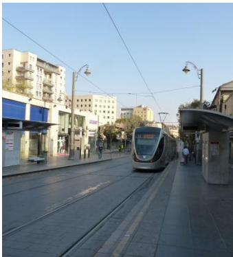
Jaffa Street, Freitag 15 Uhr Die letzte Straßenbahn

heute sende ich nur ein paar Eindrücke von meinem gestrigen Spaziergang von der Jaffastraße durchs Jaffator in die Altstadt zur Klagemauer und zurück über die Via Dolorosa, das armenische Viertel, durchs Ziontor, durchs Hinom-Tal nach Abu Tor und dann nach Talpiot, wo ich wohne.