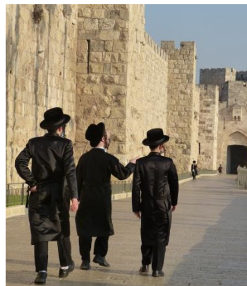
Durchs Jaffator zur Klagemauer