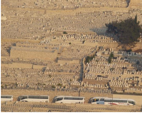
Blick auf den Ölberg – Jüdischer Friedhof