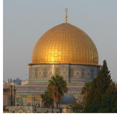
Blick auf den Tempelberg